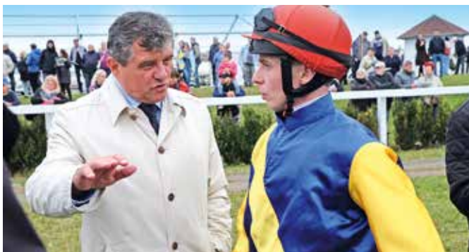
■ Swinging Thomas, Most 20. října před cenou EBF, foto: Jiří Franc