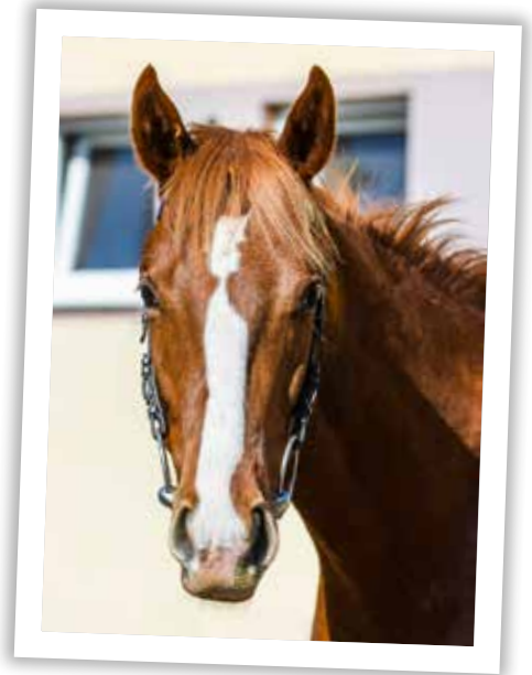
■ Swinging Thomas

Hodnoceno bylo celkem 81 koní chovaných v České republice, zatímco v roce minulém to bylo 101. Připomínáme, že aby se dvouletý kůň do hodnocení vůbec dostal, musí absolvovat minimálně dva dostihy nebo jeden vyhrát.