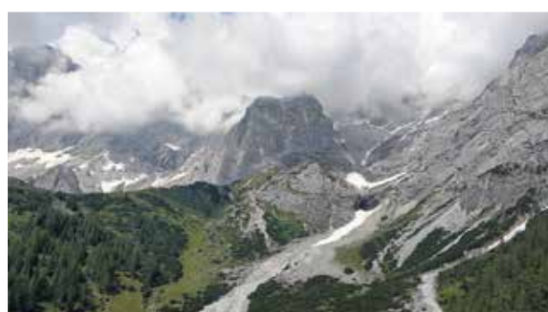
■ Čestné uznání - Cena za fotosérii, Sandra Sýkorová: Vysokohorská příroda z červencové dovolené v Rakousku a Německu