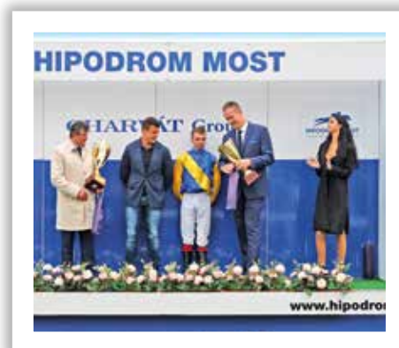
■ Českomoravská cena, vítězné podium