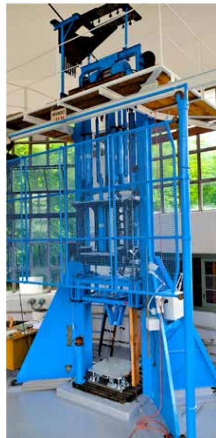
■ Renovovaný padostroj