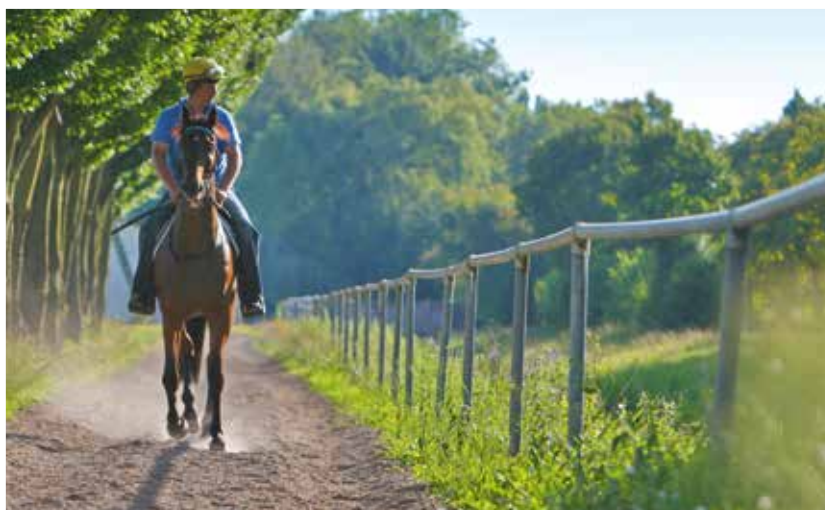
■ Přestávka mezi cestováním – závodistiště Iffezheim