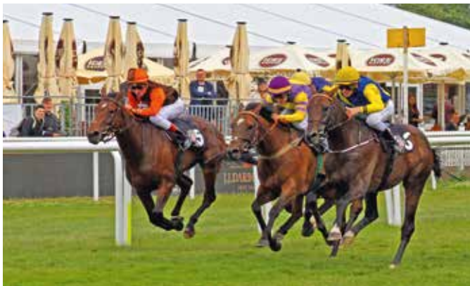
■ Hamburk, neděle 7. července

Martin Cáp, www.jezdci.cz , foto: Václav Volf, www.fotovolf.com , redakčně upraveno