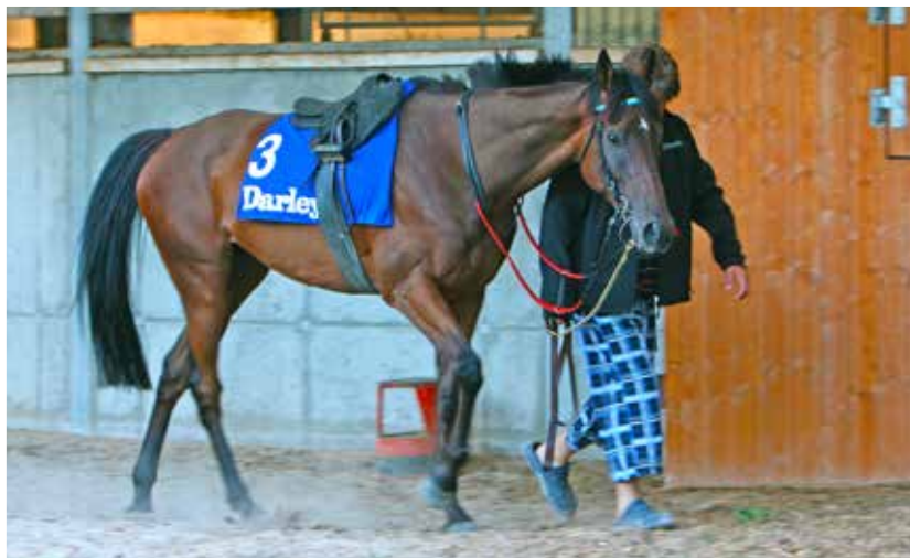
■ S trenérem