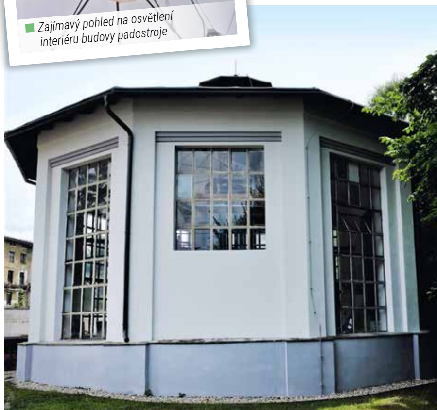
■ Samostatně stojící unikátní budova padostroje připomíná časy dávno minulé

Aktuálně probíhá rekonstrukce haly bývalé galvanovny. Po rekonstrukci sem bude umístěna technologie speciálních procesů, které nás nejvíce zdržují v kooperacích – kalení, chromování a pasivace. Případně bude-