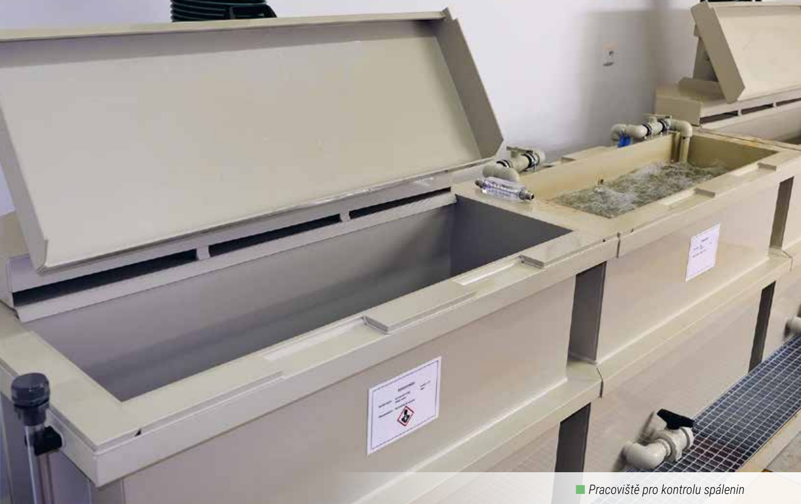
■ Pracoviště pro kontrolu spálenin