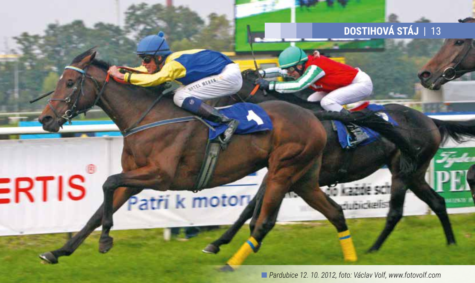
■ Pardubice 12. 10. 2012