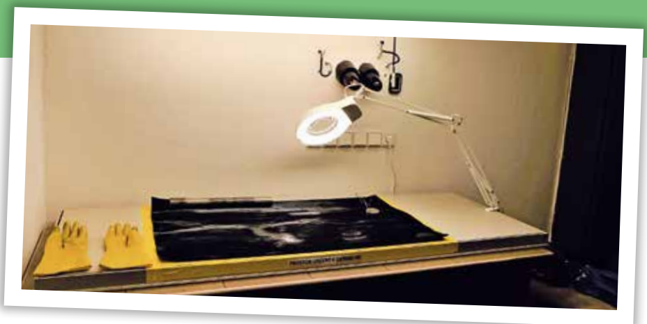
■ Vizualní kontrola spálenin probíhá pod intenzivním osvětlením

Od počátku letošního roku jsme zainvestovali do dvou nových pracovišť. Nejprve zmíním pracoviště pro kontrolu spálenin. Metodou nedestruktivního zkoušení tam detekujeme případný výskyt spáleniny. K výskytu spáleniny