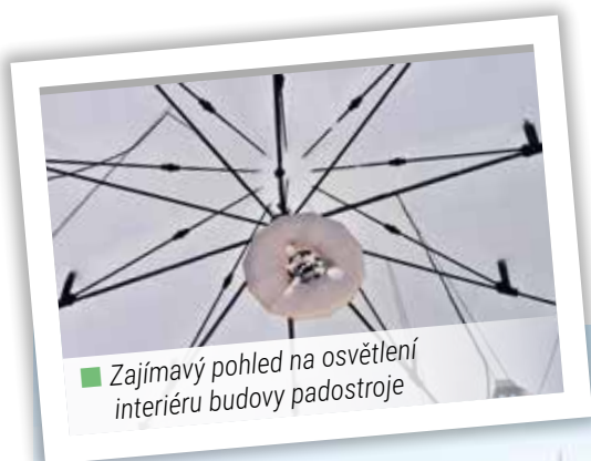
■ Zajímavý pohled na osvětlení interiéru budovy padostroje

Rozhovor s Michalem Dolejšem připravil: Jiří Franc