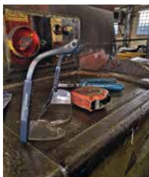
■ Lukáš Jagusztýn „Průmyslové zátiší“, 2. místo