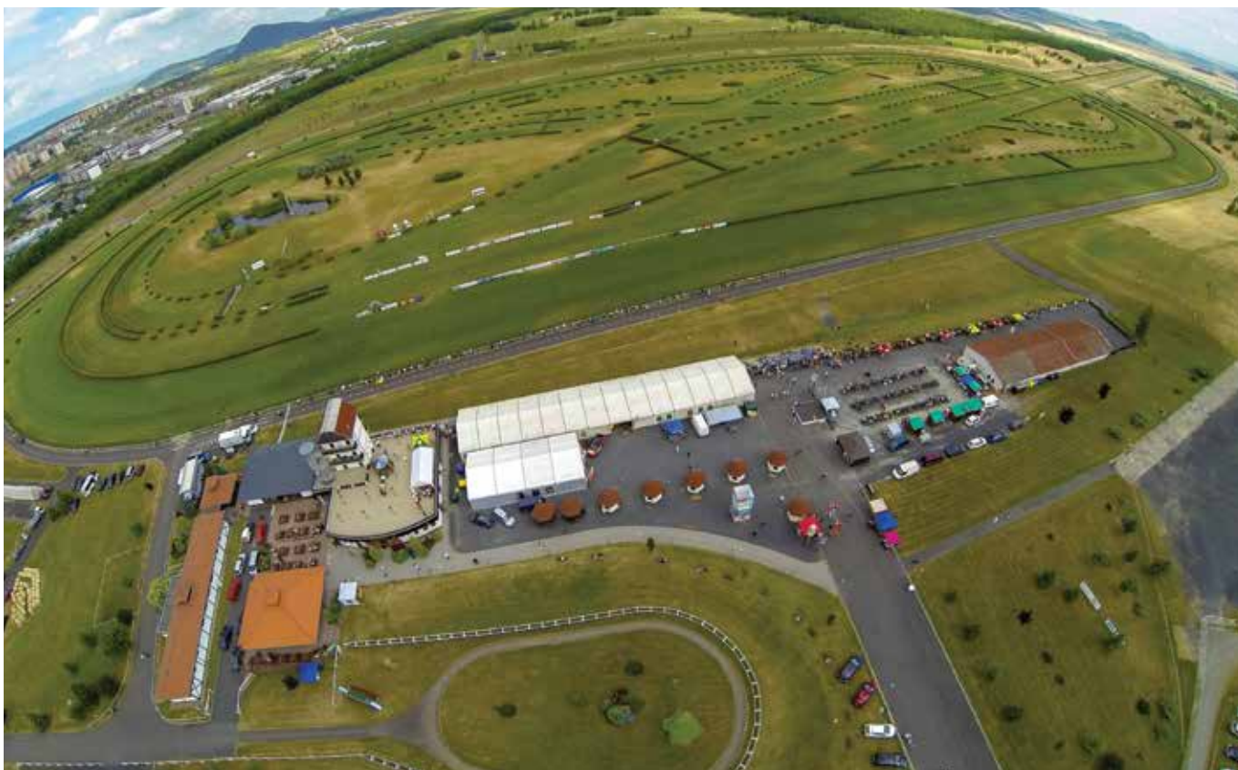
■ Letecký pohled na Hipodrom

Pavla Kubína se ptal: Jiří Franc, foto: Jiří Franc