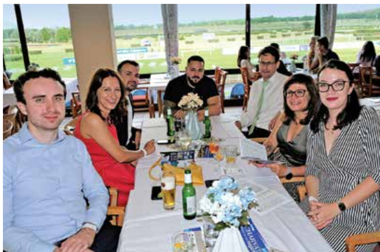
■ Jeden z našich stolů v klubu