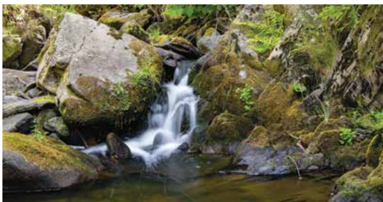
■ Na procházce v Krušných horách