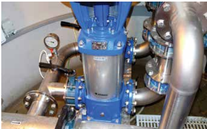
■ Chytré čerpadlo

Spodní vodárna byla opatřena novými, úspornějšími čerpadly. Stará čerpadla byla zbytečně robustní a v podstatě již neopravitelná. Nová čerpadla nabírají vodu ze spodního jezírka a novým přiváděčem ji tlačí nahoru. Dříve šla pak nahoře na Hipodromu voda z potrubí přímo do zavlažovacího systému. To jsme změnili. Voda pítéká zespodu nejprve do zrekonstruovaného rybníčku, který sloužil dříve pouze k okrasným účelům. Rybníček byl důkladně vyčištěn, opatřen novou geotextilií a nepropustnou fólií. Teprve ze zrekonstruovaného rybníčku je potom voda dále odčerpávána do zcela nové přečerpávací stanice. Je to hluboká prostorná šachta hned vedle rybníka, plná technologie. Tam je možno díky dvěma čerpadlům a moderním technologiím řídicího systému nastavit požadované tlaky pro efektivní fungování závlahového systému na drahách jedna a dvě. Jsou to tzv. chytrá čerpadla, která jsou schopna například průběžně korigovat vstupní tlaky do systému podle evidovaného zpětného odporu.