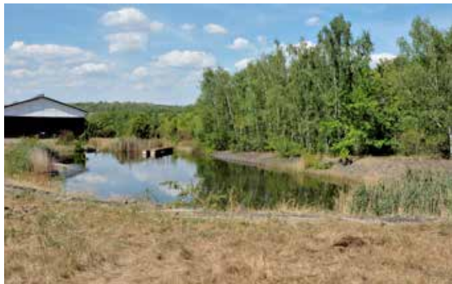
■ Spodní rybníček pod Hipodromem - voda z Ohře a budova čer. st.