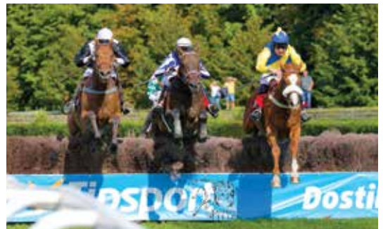
■ Vítězný Gatsby v Pardubicích