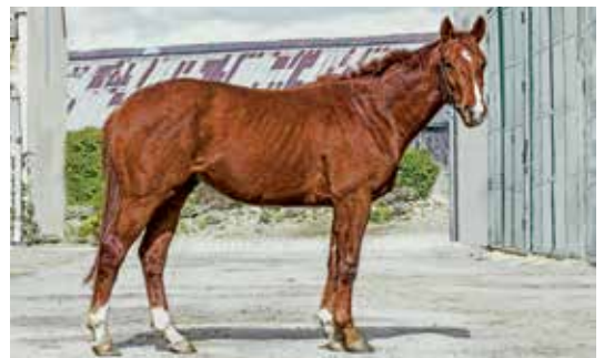
■ Fort Medoc