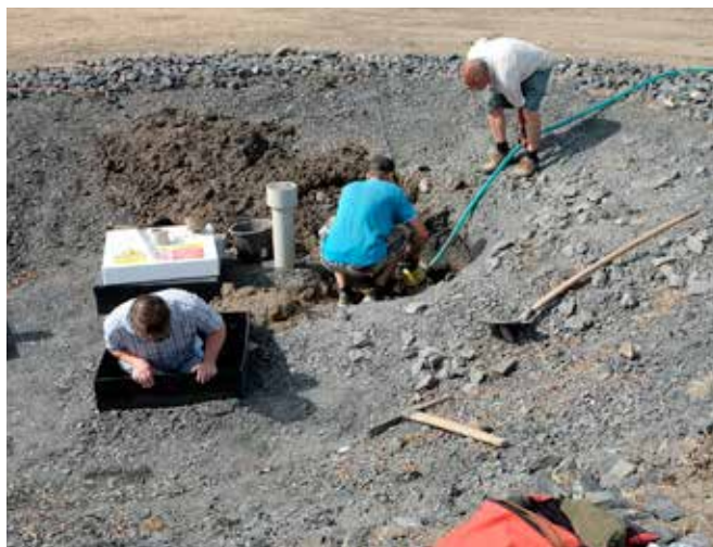
■ Práce dodavatele na vstupu do přečerpávací šachty