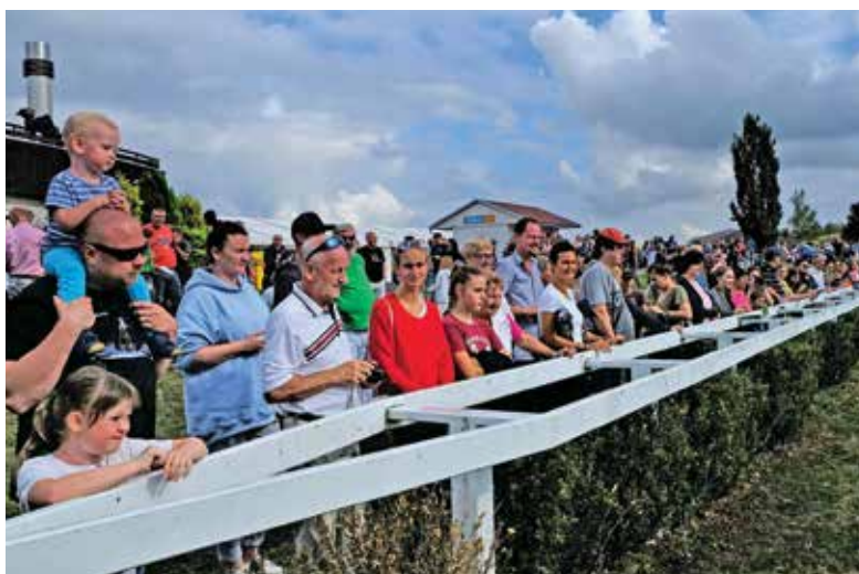
■ U paddocku bylo pořád plno