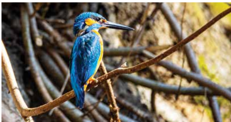
■ Ledňáček z Vavříneckého rybníka