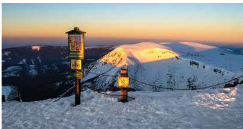
■ Východ slunce ze Sněžky