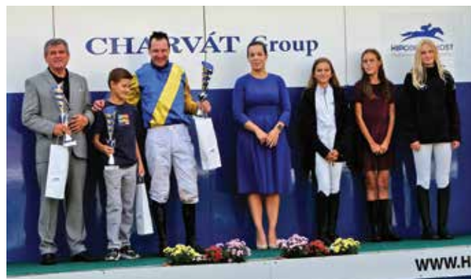
■ Vyhráli jsme