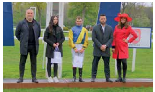
■ Petarda / Bratislava 23. 4. 2022