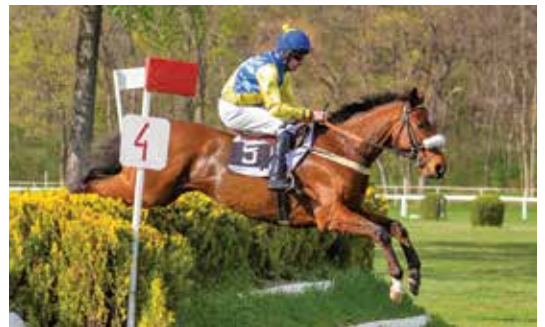
■ Roncal / Bratislava 10. 4. 2022