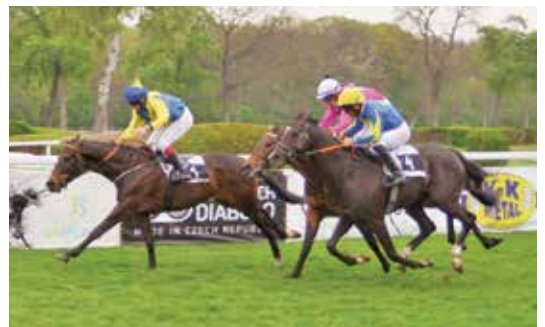
■ Petarda / Bratislava 23. 4. 2022