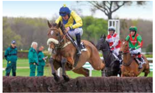
■ Arkalon / Bratislava 10. 4. 2022