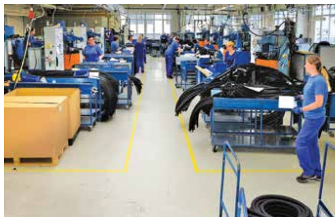
■ Výrobní hala armovaných hadic ve Zbraslavicích