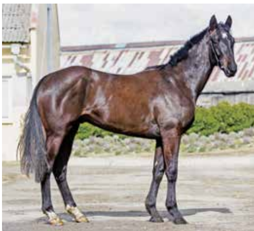
■ Don't Dream