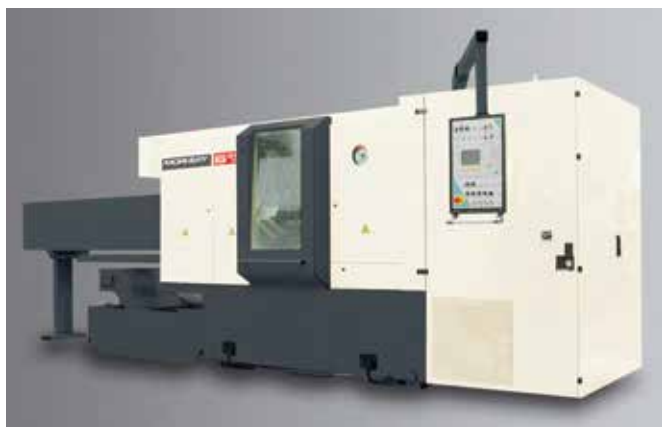
■ 8 mi vřetenový automat MORI -SAY 632 AC