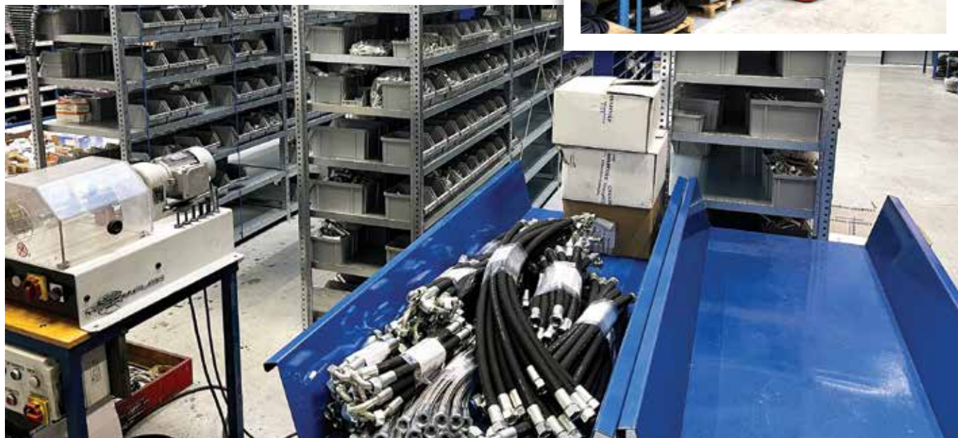
■ Prostorné výrobní a skladové zázemí je předností plzeňské provozovny