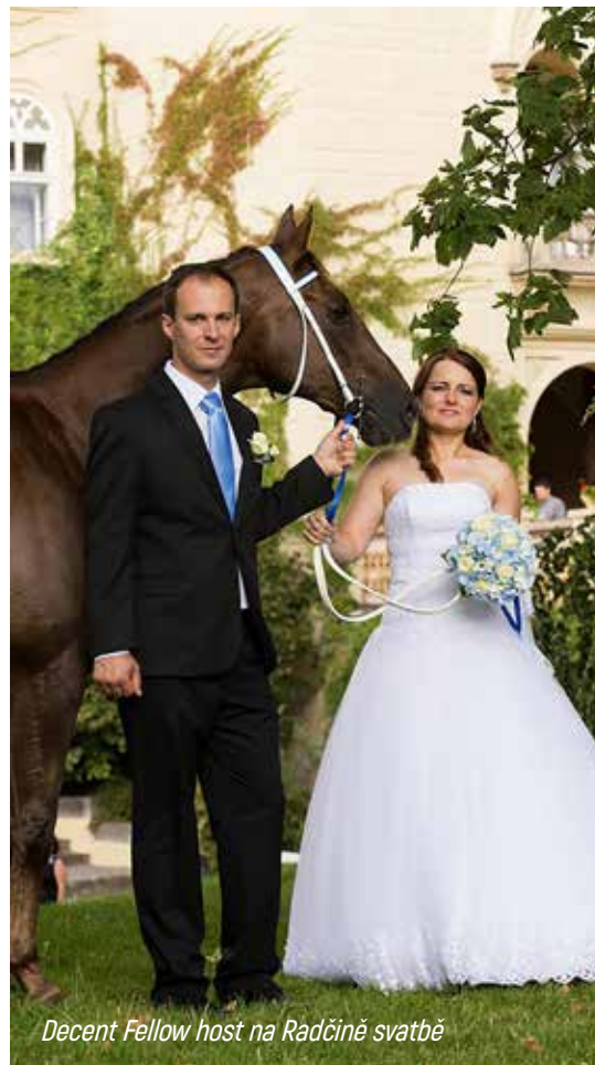
Decent Fellow host na Radčině svatbě