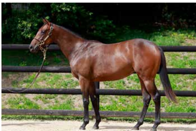
N.N. EX WINTERS MAGIC (FR)