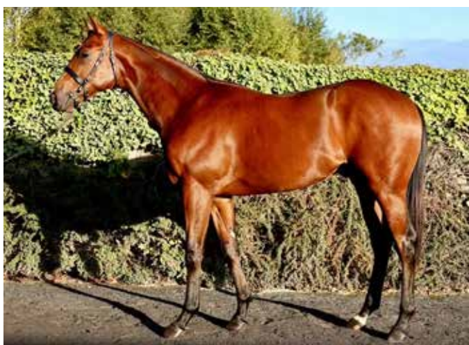
N.N. (IRE) EX KALISMA