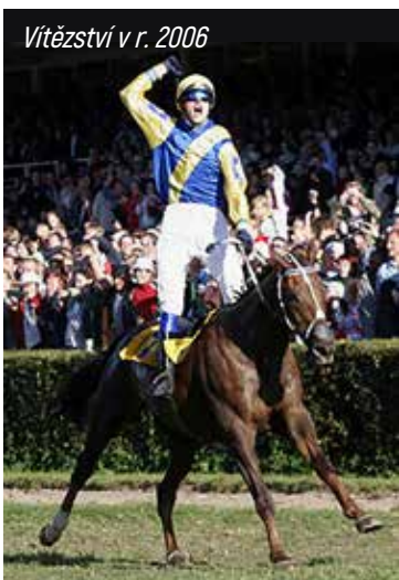
Vítězství v r. 2006

Decent Fellow byl symbolem vytrvalosti a oddanosti. Zanechal za sebou nejen obdivuhodné sportovní úspěchy, ale i hluboké vzpomínky v srdcích všech, kteří ho znali. Přejeme mu ty nejlepší nebeské pastviny.