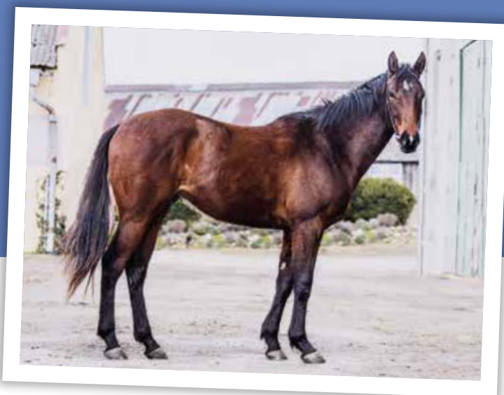
Loňský vítěz soutěže dvouletků RED CORAL