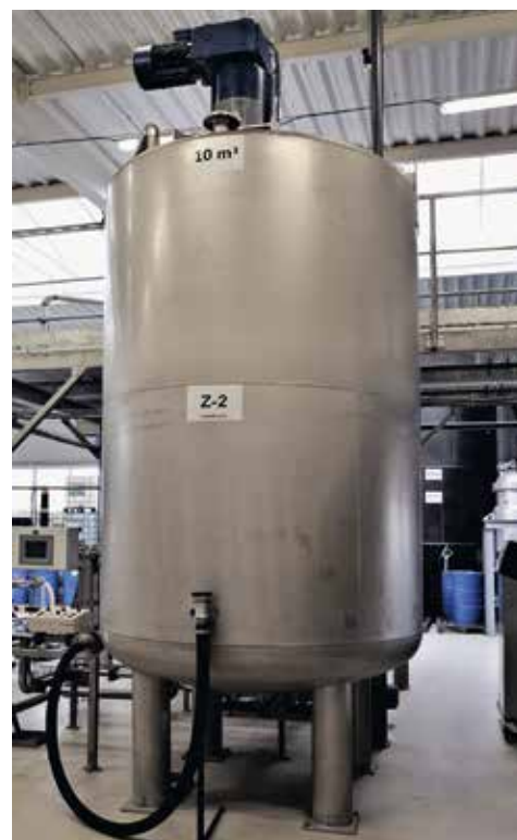
■ Nově instalovaný tank na 10 kubíků

Připravili: vedoucí prodeje Dušan Svoboda, Jiří Franc, foto: Jiří Franc