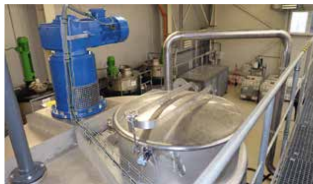
■ Horní rampa s přístupem k tanku