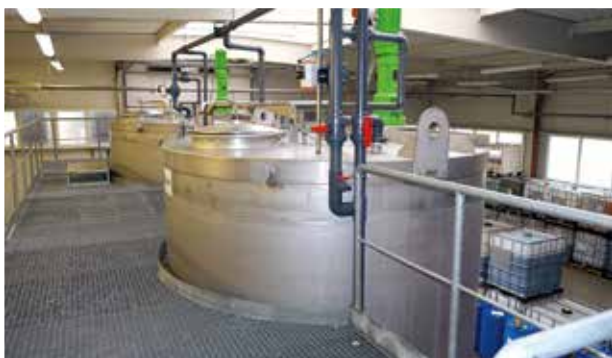
■ Pohled z horní rampy na ostatní tanky