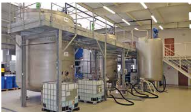
■ V tankové koloně jsou i větší tanky, než nový zcela vpravo