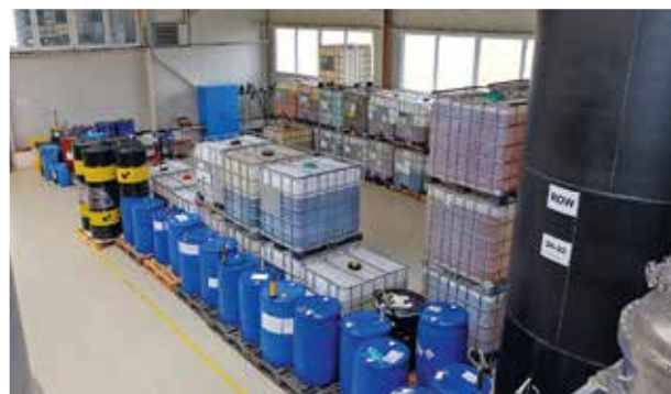
■ Skladovací zázemí přímo u výroby