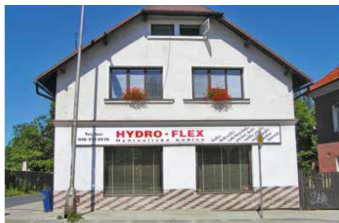
■ provozovna Liberec