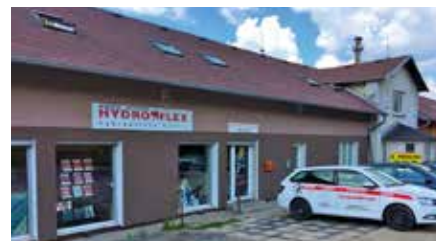
■ provozovna Sokolov