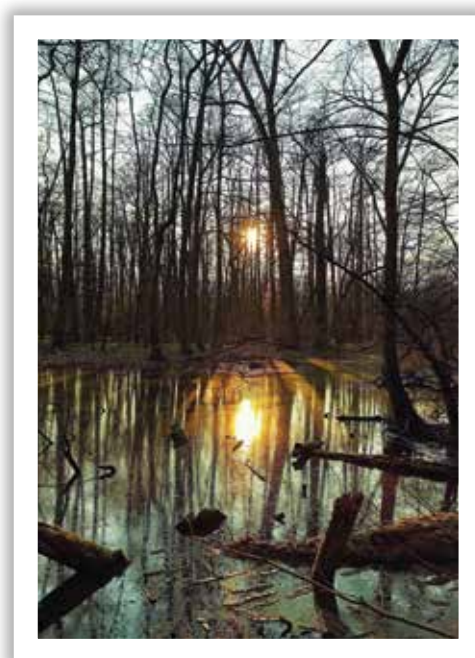
■ Tomáš Peterka, Charvát CTS, Západ slunce

Tak bychom mohli nazvat autory řady soutěžních snímků z roku 2020, které měla porota v hledáčku, ale při závěrečném hodnocení se na ně nedostalo. Vyhrát prostě nemohou všichni. Trochu to napravíme zveřejněním těchto snímků, které můžeme považovat za čtvrtfinalisty soutěže. Postoupili sice ze základní skupiny, ale do finále se nedostali – pokud použijeme sportovní výrazivo.