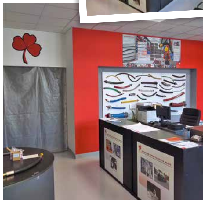
■ provozovna Praha