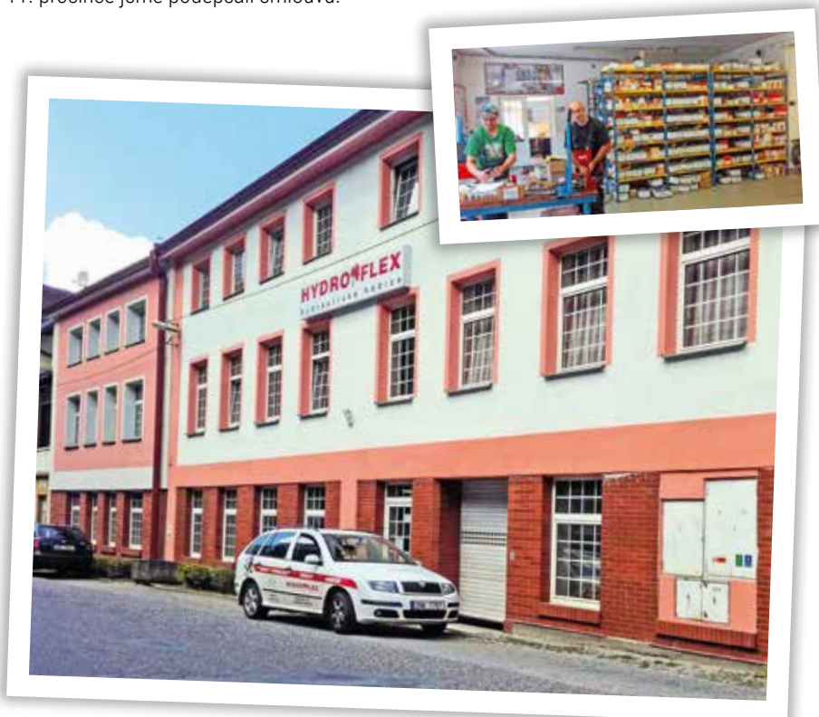
■ Nové Město nad Metují, provozovna a sídlo společnosti HYDRO-FLEX