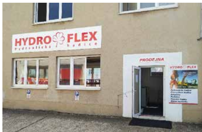
■ provozovna České Budějovice