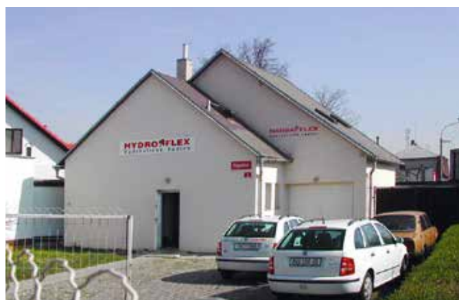
■ provozovna Plzeň