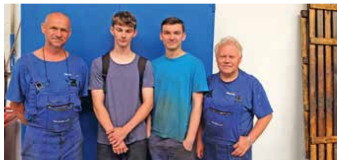
■ Naši odchovanci v r. 2020 se svými mistry odborného výcviku