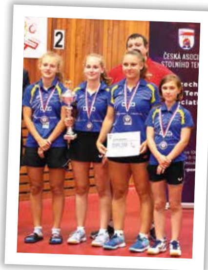
■ Medailistky dorost