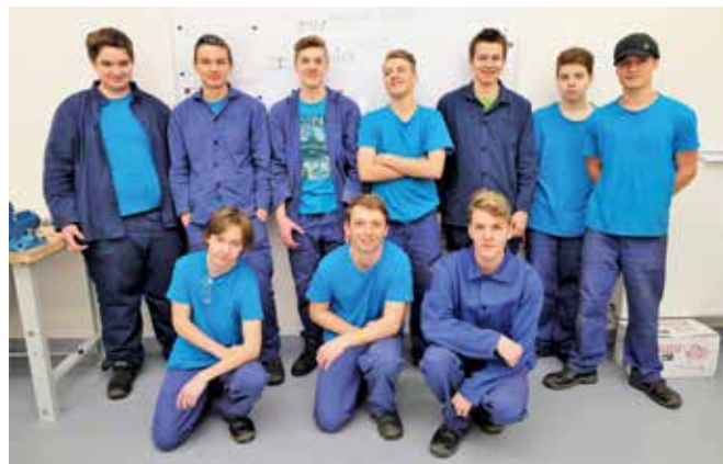
■ Takhle to všechno začalo – první ročník oboru obráběč kovů v Semilech 2017/2018

Milan Bělka, redakčně upravil Jiří Franc