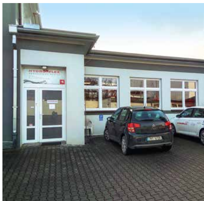
■ provozovna Praha

provozovnam budeme pristupovat individualne. V Ceskych Budejovicich jsem jiz byl a tam je jiste, ze se obe provozovny sestehuji do jedne, do nasi stavajici, nedavno nove otevrene provozovny. V Plzni bychom naopak chteli ponechat provozovny obe, protoze jednak je Plzen prumyslova mesto s velkym potencialem a jednak jsou tyto dve provozovny na opacnych koncich mesta. Nu a co se tyce prazske provozovny HYDRO-FLEXU, tam jsme teprve na pocatku uvah, jak dal. Zatim zůstávají obe.