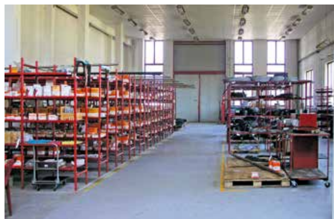
■ provozovna Hradec Králové